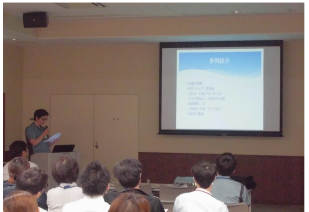
リハビリについて発表をする 新竹作業療法士