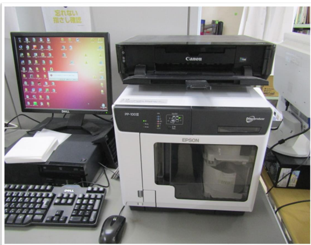
ディスクパブリッシャー