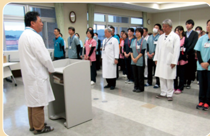
▲仕事始め式の模様

仕事始め式とあわせて永年勤続表彰を行い、今年は3名が20年勤続で表彰を受けました。