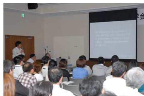
宮崎救急医学会の様子